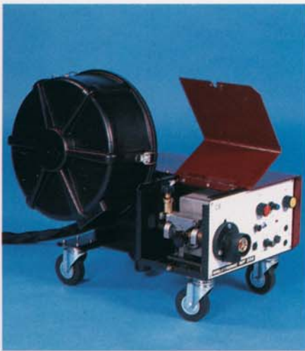
Alimentatori filo a 2 o 4 rulli Dévidoirs 2 ou 4 galets 2 or 4-roll wire feeders Vorschubkoffer mit 2 oder 4 Rollen